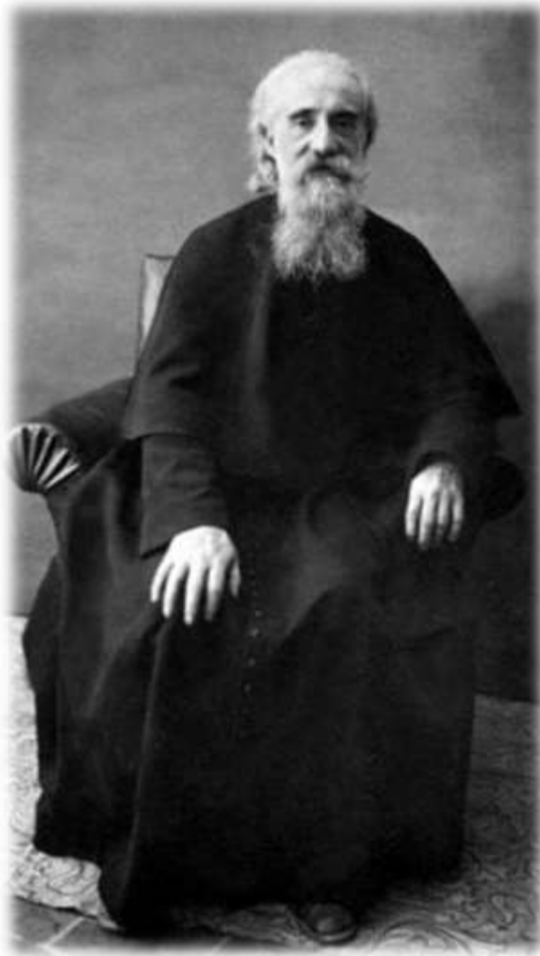
Fericitul Vladimir Ghica-prinț, preot și martir, mărturisitor exemplar al Evangheliei

Este beatificat la propunerea arhiecezei de București, iar Papa Francisc semnează decretul prin care recunoaște martirajul robului credincios al lui Dumnezeu, Monseniorul Vladimir Ghica. El se numără în rândul vameșilor prin excelență, deoarece viața sa a fost o continuă mărturisire a lui Christos, și o mireasmă dătătoare de viață.