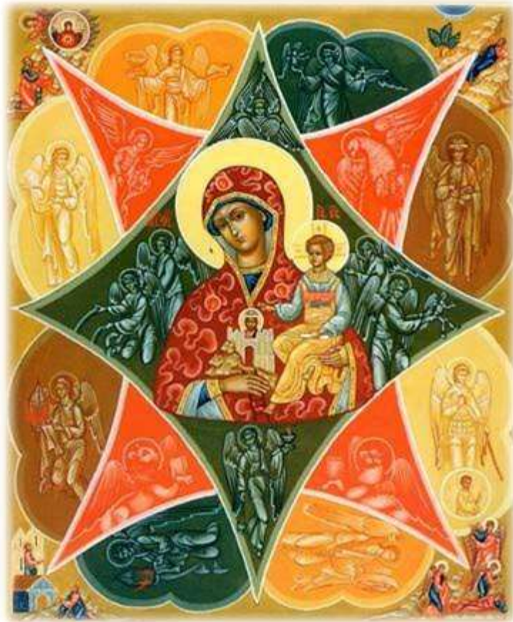
Icoana Maicii Domnului, Rugul aprins

au trăit-o pe culmi ale ei și au pornit spre amiaza eternității lui Dumnezeu. În mijlocul acestei frumoase mișcării de renaștere stă icoana Maicii Domnului denumită Rugul aprins.