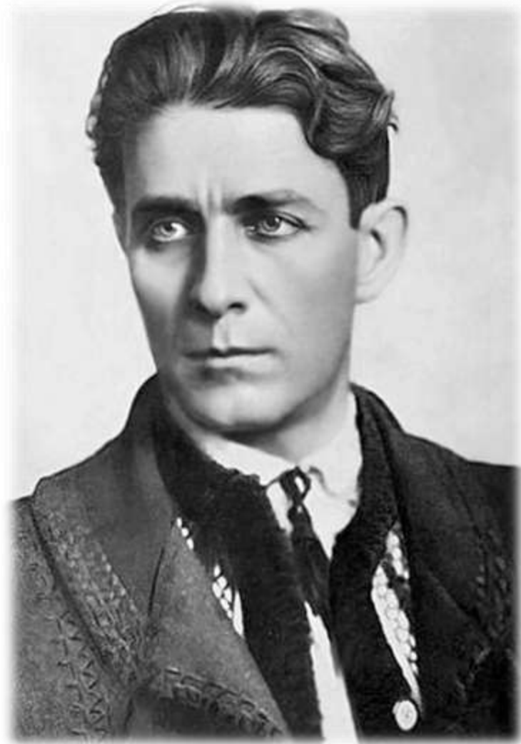
Corneliu Zelea Codreanu

poate cucerii lumea, iar prin această dragoste Dumnezeu a cucerit și inimile multor legionari. Chemarea evangheliei este ușor de înțeles iar acela care ne cheamă o face și azi.